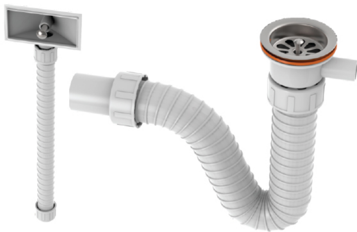
k.br. 2204 Sifon za jednodelnu sudoperu sa prelivom