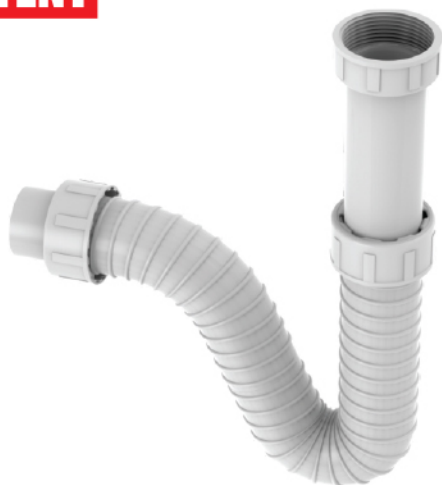
k.br. 2211 Sifon za bide (podsklop) 5/4"