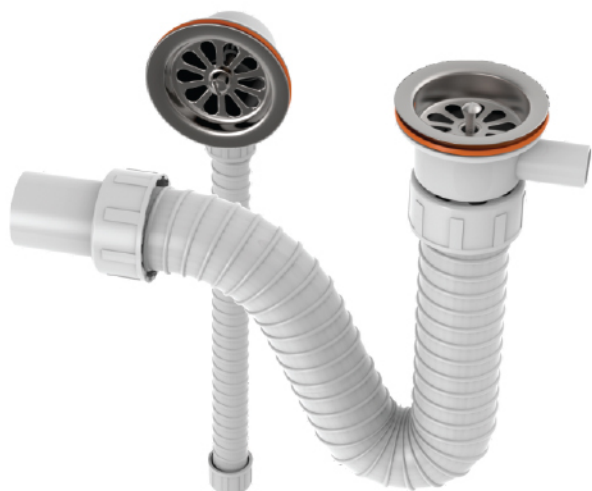
k.br. 2206 Odliv-preliv za kadu