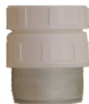
k.br. 2234 5/4"