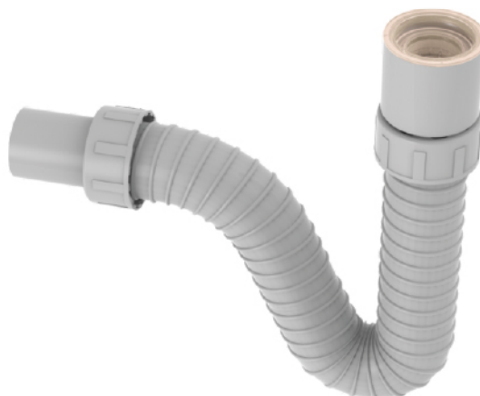
k.br. 2250 Sifon pisoara