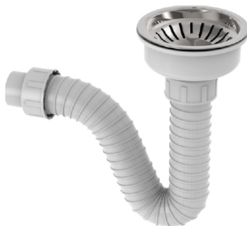
k.br. 2176 Sifon jednodelne sudopere sa rešetkom Ø 115