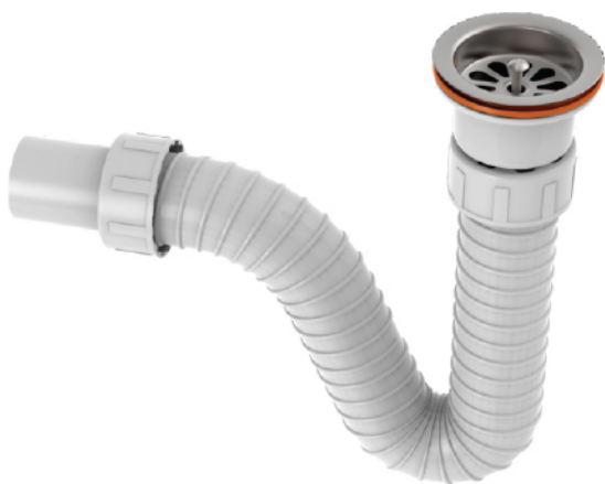
k.br. 2201 Sifon za lavabo