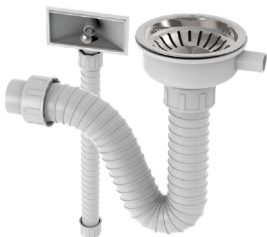
k.br. 2177 Sifon jednodelne sudopere sa prelivom i rešetkom Ø 115