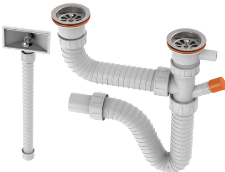
k.br. 2205 Sifon dvodelne sudopere sa prelivom i priključkom za mašinu za sudove