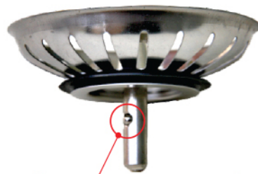
Inox kuglica na situ