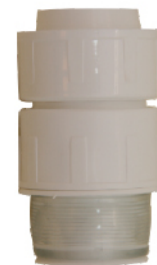
k.br. 2233 5/4"