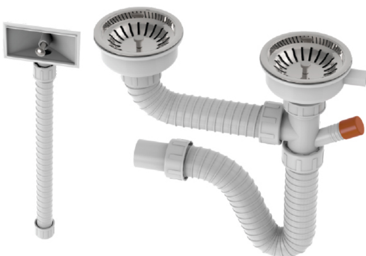
k.br. 2178 Sifon dvodelne sudopere sa prelivom i rešetkom Ø 115