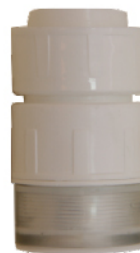
k.br. 2228 6/4"