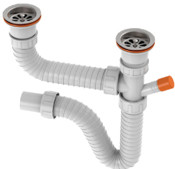
k.br. 2203 Sifon dvodelne sudopere